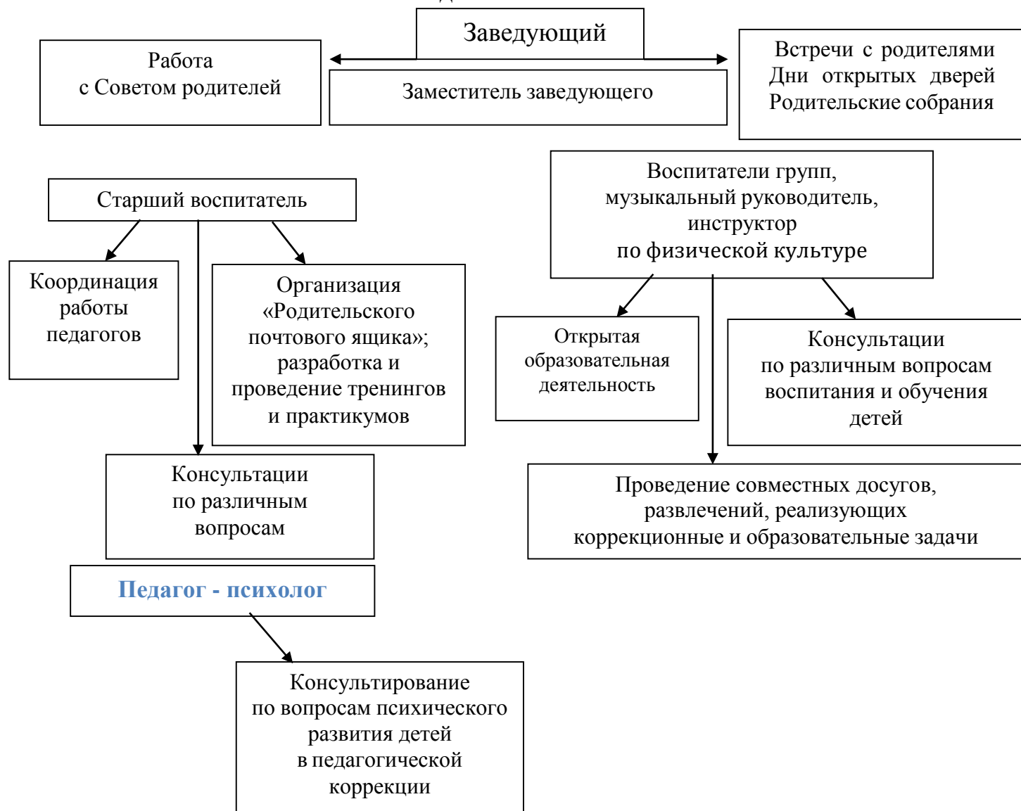
Схема взаимодействия с семьями воспитанников